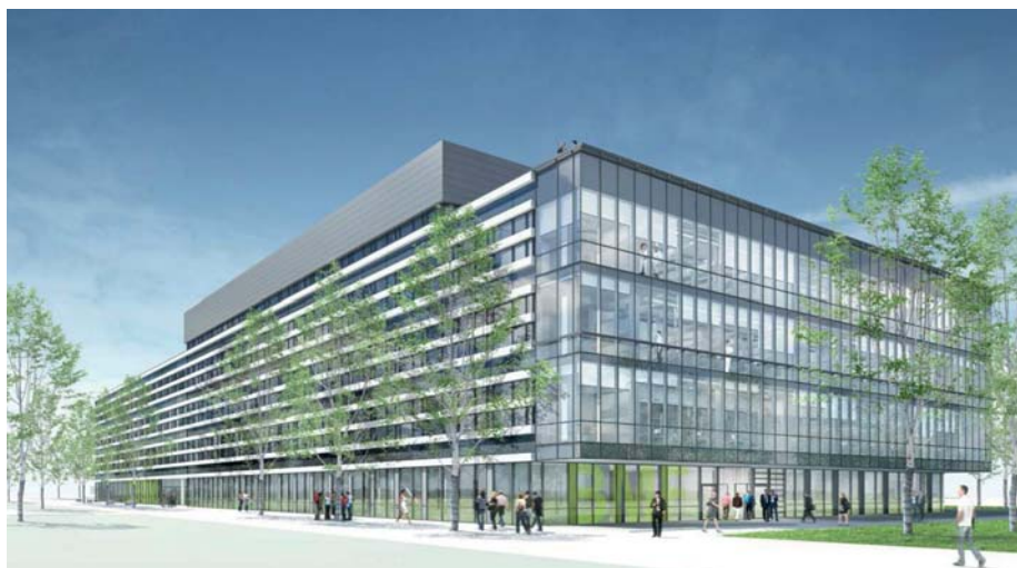
Die gläserne Fassade des Neubaus für die Biomedizinische Forschung auf dem Campus der Universität zu Lübeck macht Wissenschaft transparent (Entwurf und Visualisierung: Hammeskreuze Architekten)

Ein wichtiges Argument für die Umwandlung der Universität in eine Stiftung öffentlichen Rechts bildet die Erwartung, in dieser Struktur Zugang zu nichtöffentlichen Geldquellen für eine nachhaltige Entwicklung zu erhalten. Dabei werden neben Zuwendungen von Stiftern und Mäzenen Partnerschaften mit der Wirtschaft als Impulsgeber verstanden. So positioniert sich die Universität mit der Zu-