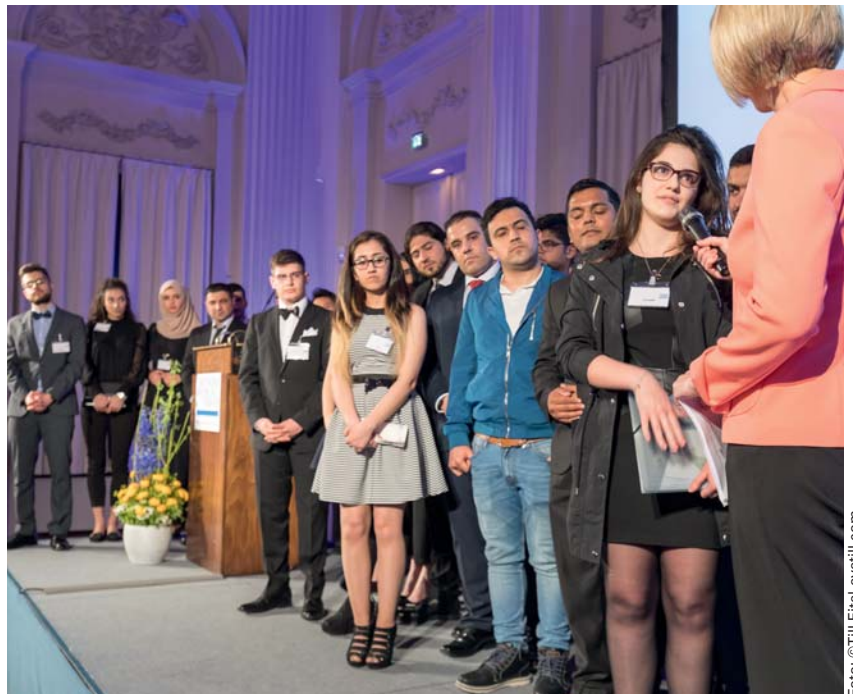
Gala der deutschen Wissenschaft 2017: Stipendiaten stellen sich vor.

dann den Stipendiaten, ihre Netzwerke weiter auszubauen und damit ihre Zukunftschancen zu erhöhen.